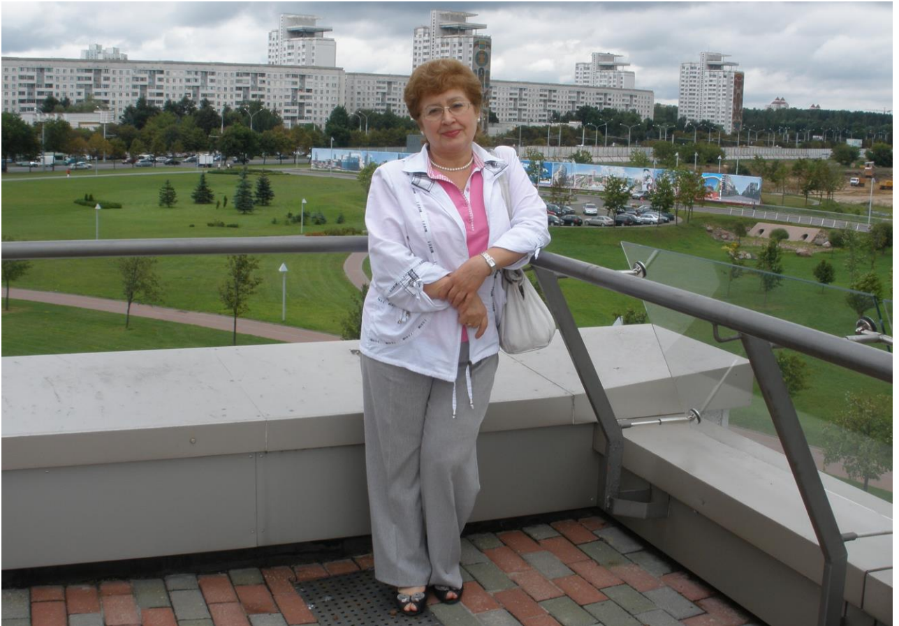
На панорамному поверсі книгозбірні під час робочої поїздки до Національної бібліотеки Білорусі. м. Мінськ, липень–серпень 2011 р.